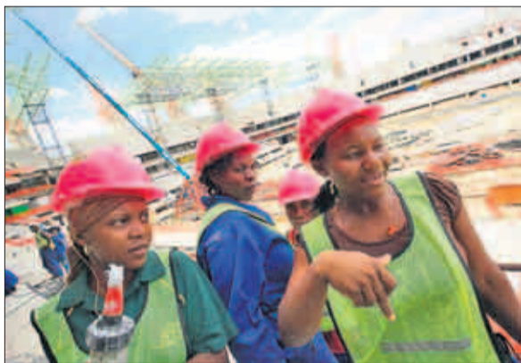
Arbeiterinnen in Nelspruits neuem Stadion, einem der zehn Austragungsorte in Südafrika (siehe Karte).