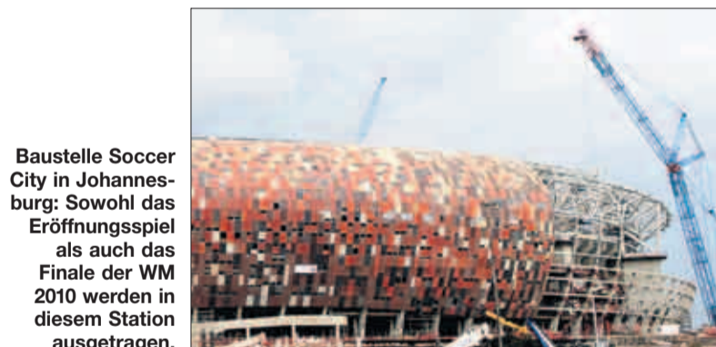
Baustelle Soccer City in Johannesburg: Sowohl das Eröffnungsspiel als auch das Finale der WM 2010 werden in diesem Stadion ausgetragen.