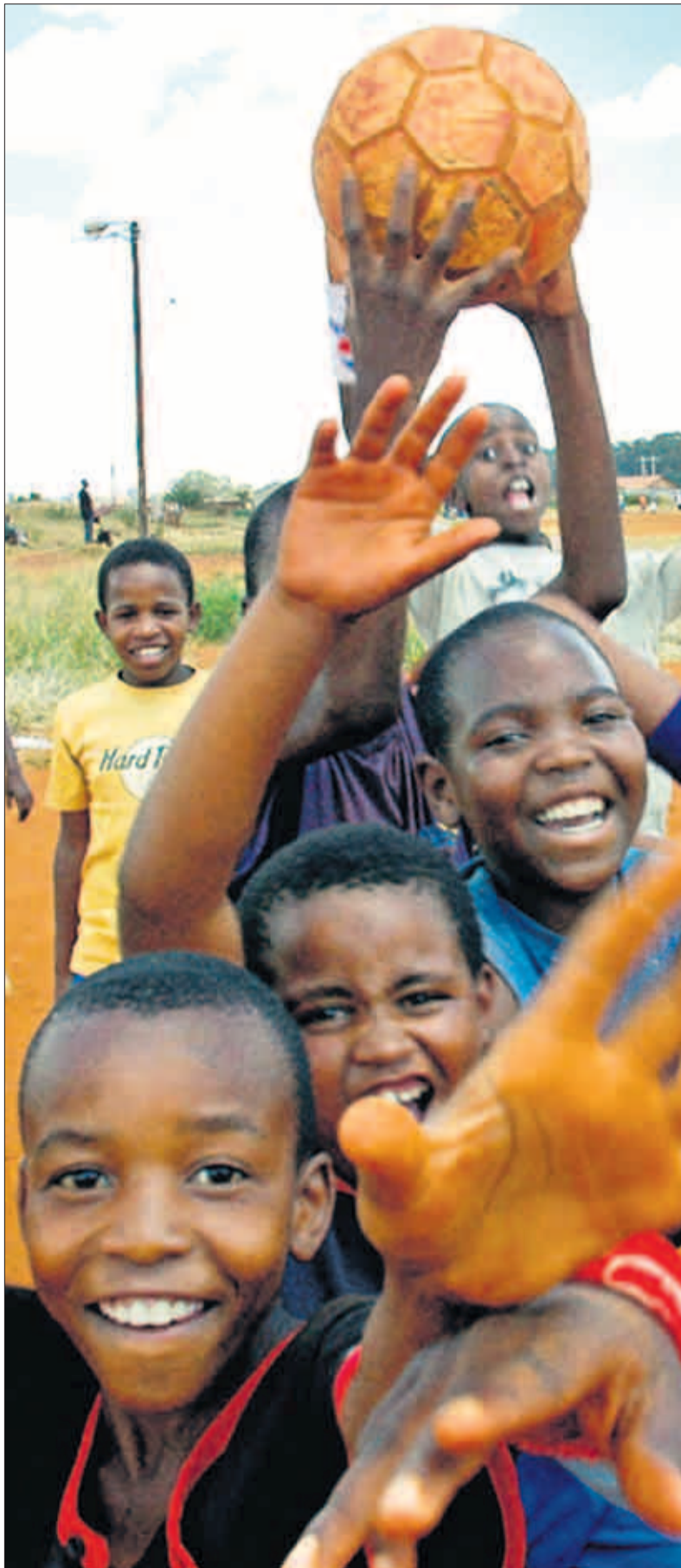
Die Fußballstars von morgen? Kinder fiebern in einem Township der Weltmeisterschaft entgegen.